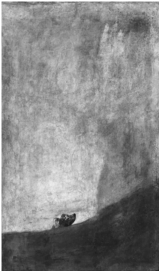
Francisco de Goya, Perro semihundido (1820-1823). Obra enigmática y metafísica que forma parte de la serie «Pinturas negras».