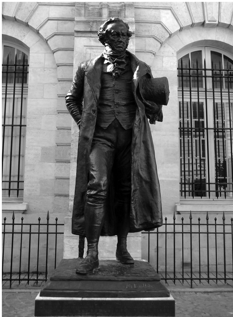
La estatua de Goya realizada por Mariano Benlliure, erigida hoy día en la rue Mably, es un regalo de la ciudad de Madrid a Burdeos.