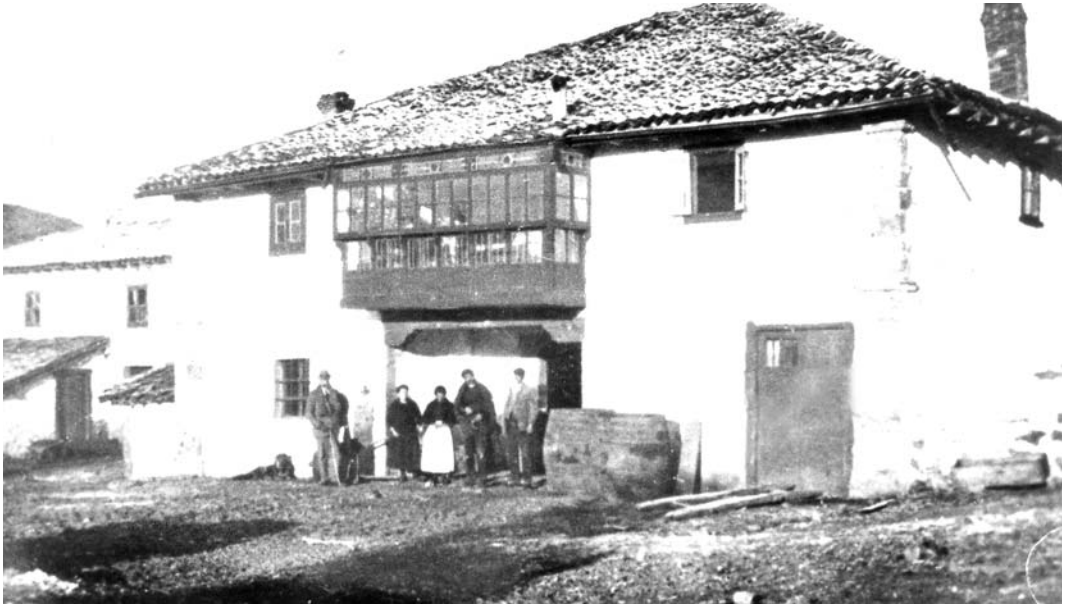
Imagen de la Venta Campa en torno a 1910. Puede apreciarse que todavía no se había ampliado la galería del piso superior, obra realizada en torno a 1915 por un carpintero de Valdeprado.