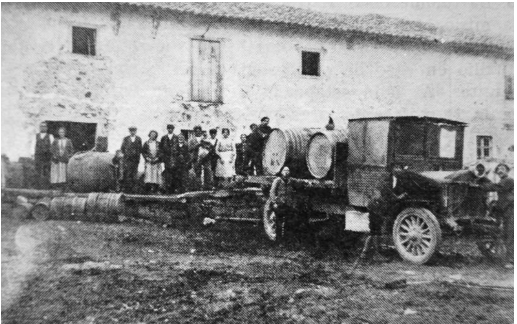
Venta Urbaneja a comienzos del siglo pasado.