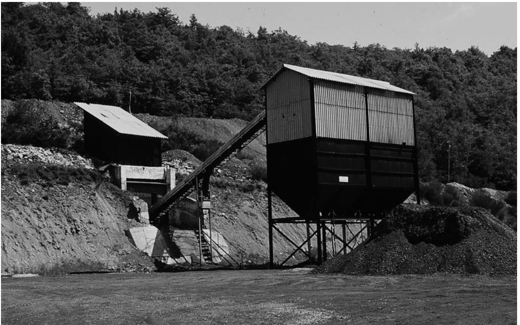
En los años noventa fueron desapareciendo las minas en La Pernía, con el cierre de explotaciones como Mina Eugenia. En 2004 se cerró Montebismo, la última explotación minera de la zona.