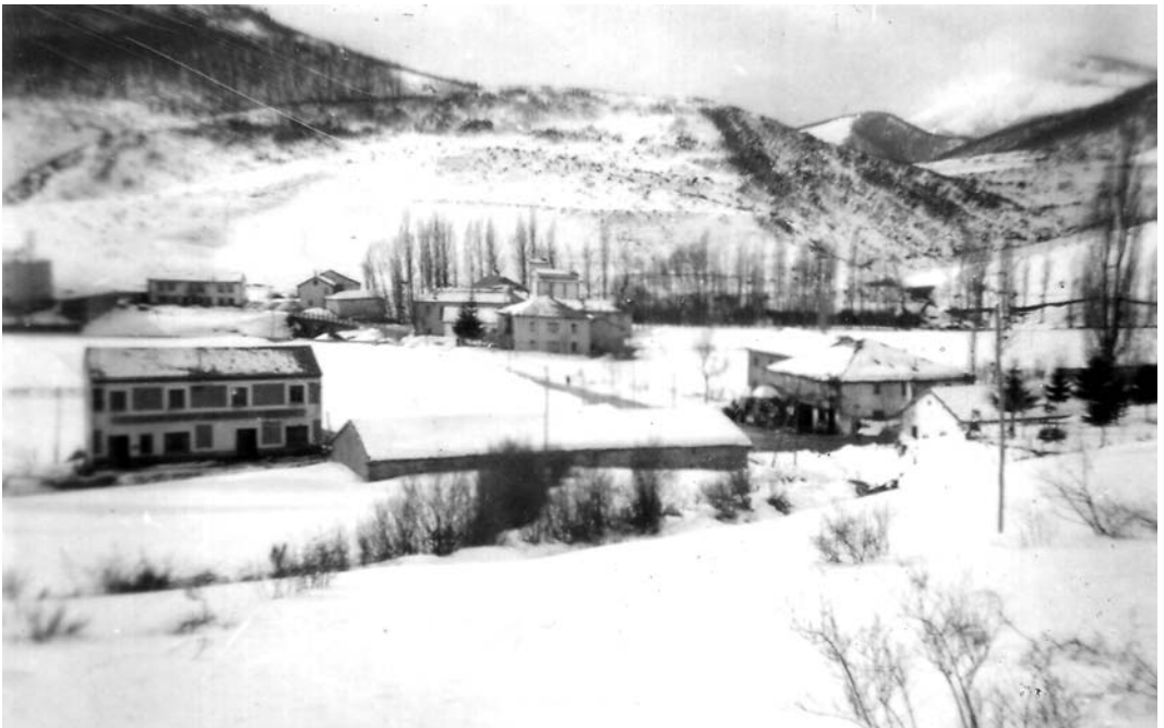
Nevada en San Salvador en los años cincuenta. (Página siguiente: Bella imagen de los vecinos de Polentinos abriendo las calles del pueblo con la pala tras una fuerte nevada).